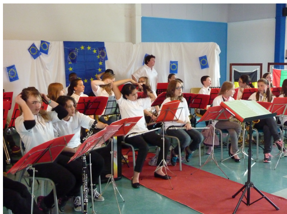
La classe orchestre