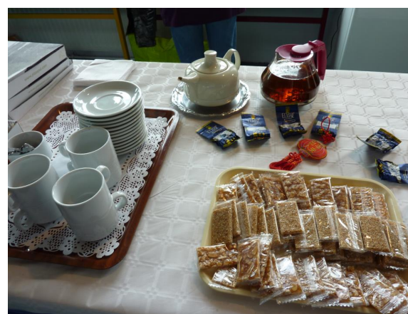
Les spécialités chinoises