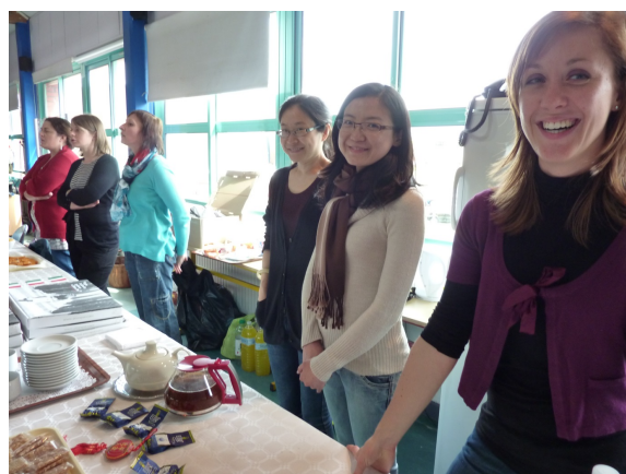
Les professeurs de langues