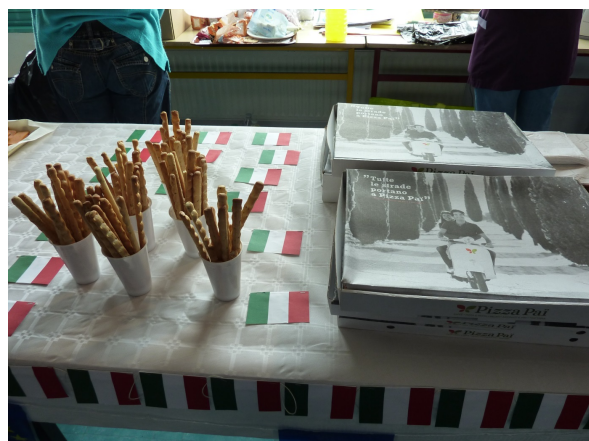
Les spécialités Italiennes