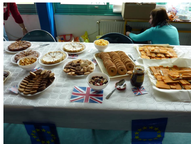
Les spécialités Anglaises

La semaine des langues a eu lieu du 21 au 24 mai. Ce fut l'occasion de mettre en valeur l'anglais, l'allemand, l'espagnol, l'italien et le chinois enseignés au collège. Des expositions multiples célébrant les pays ont permis aux élèves de s'imprégner des différentes cultures. Le vendredi après-midi, des collations typiques ont fait la joie des gourmands.