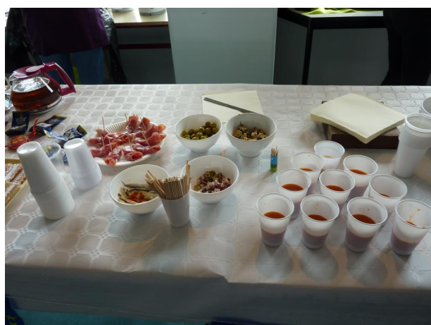
Les spécialités espagnoles