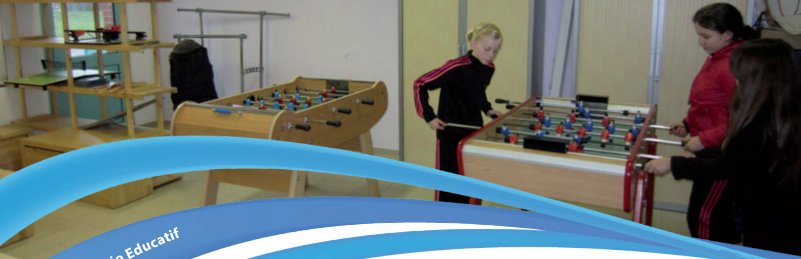
Foyer Socio Educatif