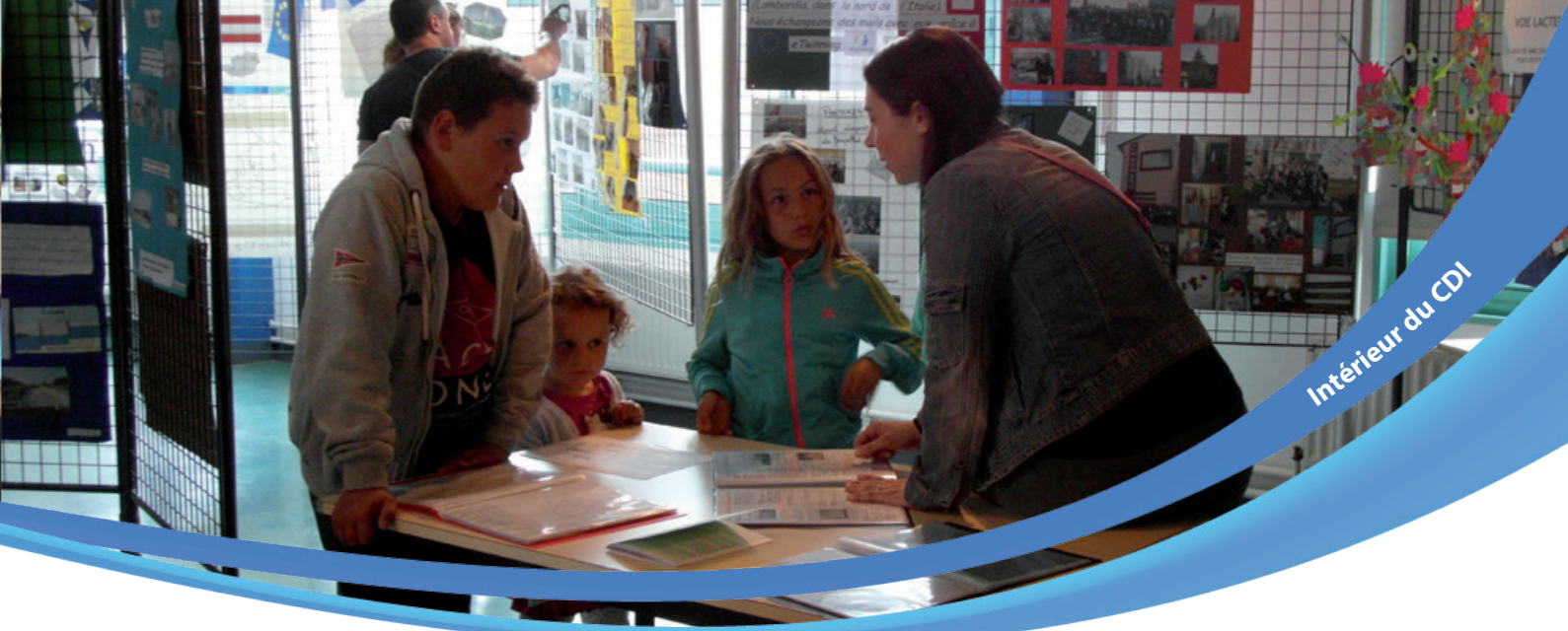
Intérieur du CDI