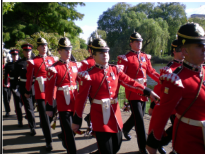
La relève de la garde!