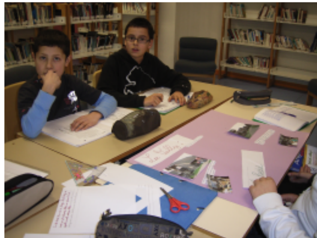
Les élèves de 4ème au CDI en train de réaliser les affiches sur le voyage à Londres

Je fais 2 heures dans la semaine, le lundi et le jeudi.