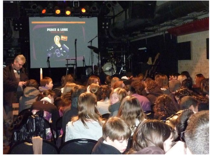
Dans la salle de concert des "4 Écluses"

Le groupe a montré l'évolution des instruments de musique de façon chronologique en