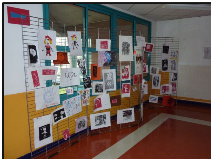
Des productions d'élèves en arts plastiques

Il y avait encore l'option découverte professionnelle réservée aux 3èmes, l'école ouverte, la technologie, le secourisme avec l'infirmière, les sciences physiques, les SVT, le dub hispano, la découverte de l'italien et les dispositifs d'aide et de soutien comme l'accompagnement éducatif et le PPRÉ.