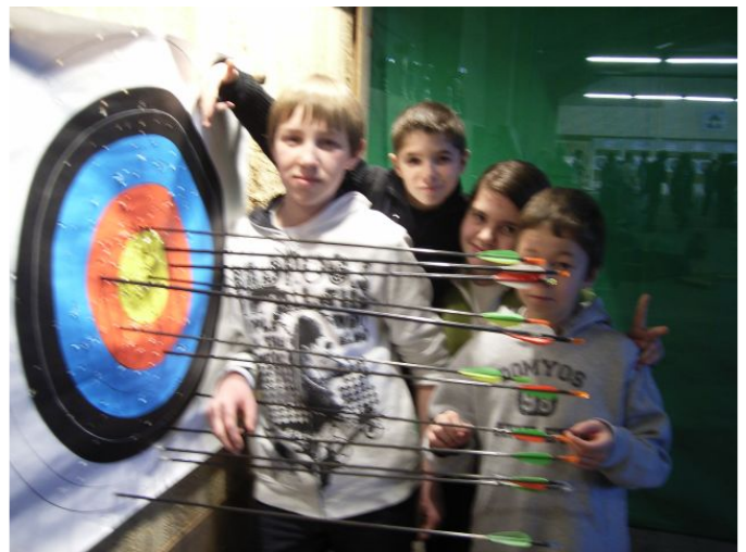
Notre équipe en compétition à Bergues

Le mercredi 9 février 2011 il y a eu un concours de tir à l'arc de 8h15 à 16h30 à Bergues. J'aime le tir à l'arc car on peut se prendre pour un archer.