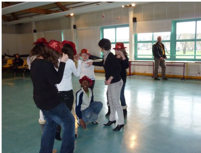
La dernière répétition avant le grand spectacle