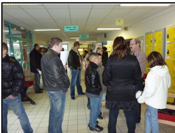
Des parents d'élèves montrent le fonctionnement du collège.

Ce samedi 22 janvier, je suis allé à la journée Portes Ouvertes du collège du Moulin. Les visiteurs étaient attendus par des professeurs pour les guider dans le collège. Dans le hall, il y avait une exposition des travaux d'art plastiques et on pouvait voir des reportages de l'ASTV.