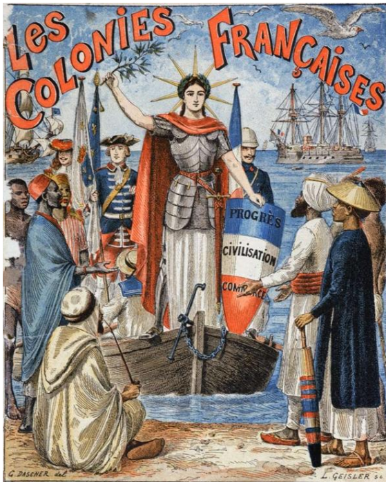
Couverture d'un cahier scolaire français vers 1900

Compétence : Analyser et comprendre un document