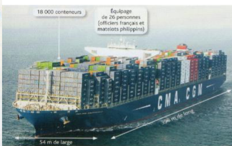
1 Le porte-conteneurs Bougainville de la CMA-CCM Le Bougainville a été construit en Corée du Sud, par le chantier naval coréen Samsung Industries. Il a été inauguré dans le port du Havre le 6 octobre 2015.