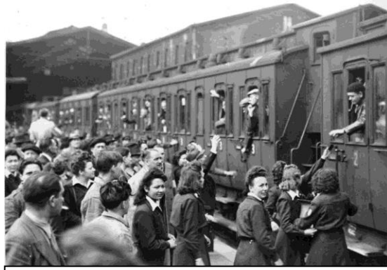
Départ de travailleurs français du « service du travail obligatoire (STO) » pour l'Allemagne (gare de Paris, 1943)

Les documents ci-dessus sont répartis en 4 thématiques qui illustrent chacune des caractéristiques principales du régime de Vichy : un régime antisémite / Un régime autoritaire (dictature) / Un régime qui collabore (aide les Allemands) / un régime réactionnaire (retour à d'anciennes valeurs). Vous vous appuyerez sur les documents pour compléter la carte mentale et expliquer chacune de ces caractéristiques.