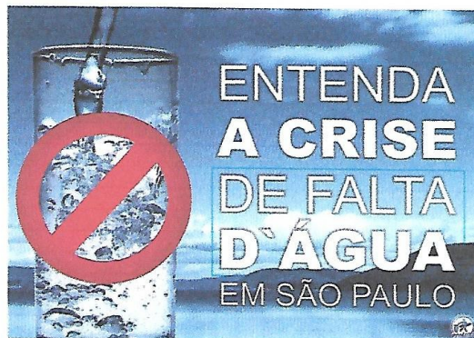
Affiche de sensibilisation de l'association Ecosurf. Traduction : « Comprendre la crise de la pénurie d'eau à São Paulo ».

La métropole de São Paulo connaît une inquiétante pénurie d'eau en raison de l'augmentation de sa consommation, de l'insuffisance des équipements hydrauliques et des sécheresses plus fréquentes.