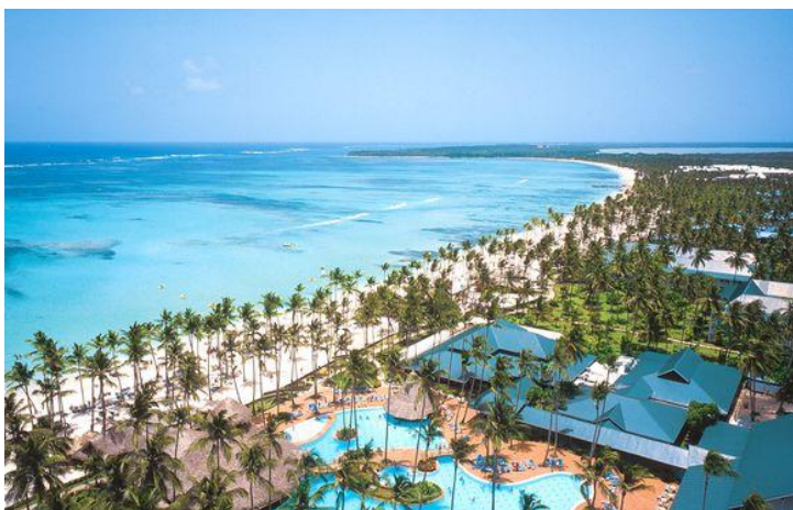
2 Hôtel Barcelo de Punta Cana