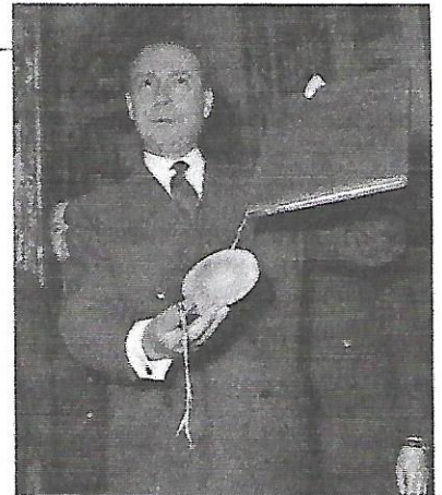
Michel Debré, ministre de la Justice, présentant la Constitution de la V e république, le 7 octobre 1958.

Art. 1bis. L'Union est fondée sur les valeurs de respect de la dignité humaine, de liberté, de démocratie, d'égalité, de l'État de droit, ainsi que de respect des droits de l'homme, y compris des droits des personnes appartenant à des minorités. Ces valeurs sont communes aux États membres dans une société caractérisée par le pluralisme, la non-discrimination, la tolérance, la justice, la solidarité et l'égalité entre les femmes et les hommes.