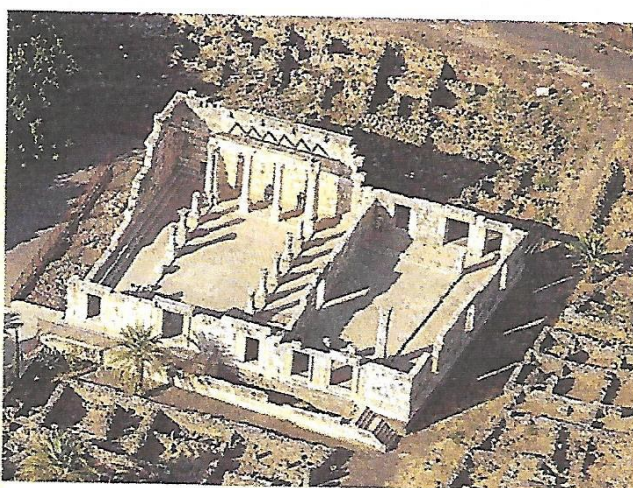
La synagogue de Capharnaüm en Palestine (III e siècle après J.-C.)