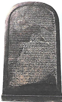
Stèle de Mesha (vers 830 avant J.-C.).